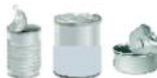
Boîtes et emballages métalliques