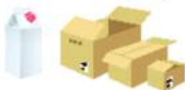
Emballages cartons, briques alimentaires