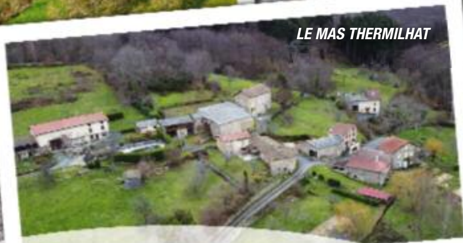
LE MAS THERMILHAT

Ces prises de vue réalisées à partir d'un objet volant bien identifié, piloté par Adèle CHARRIER et Eddy DUMONTET, au gré des caprices météorologiques de ces derniers jours, illustrent magnifiquement la douceur de vivre à Ste Agathe. Cette douceur, véritable art de vivre, est le lien qui nous unit et nous rassemble malgré nos différences et nos particularités, au sein de la belle et grande famille des saintagathois. Merci à nos deux pilotes.